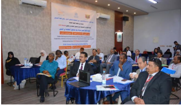
5. إقرار الخطة السنوية للسكرتارية 2023.

في الاجتماعين أكد أعضاء لجنة التسيير على أهمية التغذية والتعريف بقضايا التغذية وأوصوا بضرورة تفعيل إستراتيجية المناصرة على أعلى المستويات والتعريف بالدور الهام الذي تقوم به سكرتارية رفع مستوى التغذية في اليمن، وتبسيط الضوء على الجهود والخطط التي تم إعدادها، كما أوصى الأعضاء بأن تضاف تدخلات وأنشطة الخطط القطاعية لرفع مستوى التغذية في اليمن في خطط الجهات المعنية.