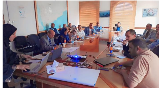
مجموعة عمل الزراعة والثروة السمكية والصناعة