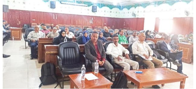
مجموعة عمل الصحة