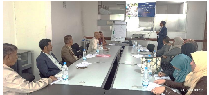
مجموعة عمل المياه والبيئة