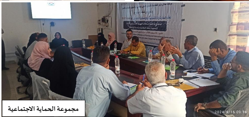
مجموعة الحماية الاجتماعية